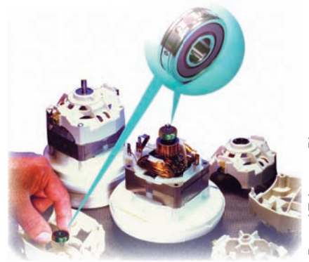
Rencol Tolerance Rings