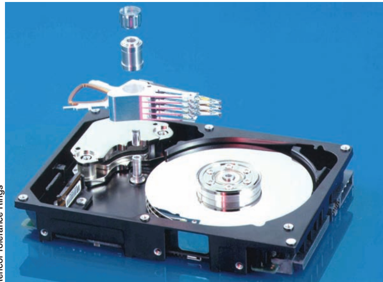
Rencol Tolerance Rings

Tous les anneaux de tolérance, quel que soit leur type, ont une caractéristique fondamentale en commun : une série de reliefs ou d'« ondulations » au niveau de leur circonférence. Chacune de ces ondulations agit comme une sorte de ressort radial qui, lorsque l'anneau de tolérance est en