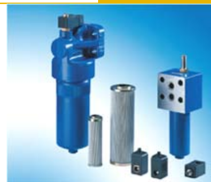
Le suivi des fluides en service permet de garantir les performances des systèmes

La négligence coûte cher ! Quelque 70 à 80% des problèmes survenant dans un circuit de transmission de puissance résultent directement de la contamination du fluide. C'est pour l'avoir trop souvent ignoré que nombre d'utilisateurs font face à des coûts importants en termes de vidange complète de la charge d'huile, changement de pièces endommagées ou, pire encore, arrêt complet de la machine. Et pourtant, suivre régulièrement la qualité de son fluide est relativement aisé. Les moyens existent il ne reste plus qu'à les utiliser. Et donc à consentir les investissements nécessaires dont le retour, pas forcément quantifiable à l'instant T, s'avère inestimable à long terme.