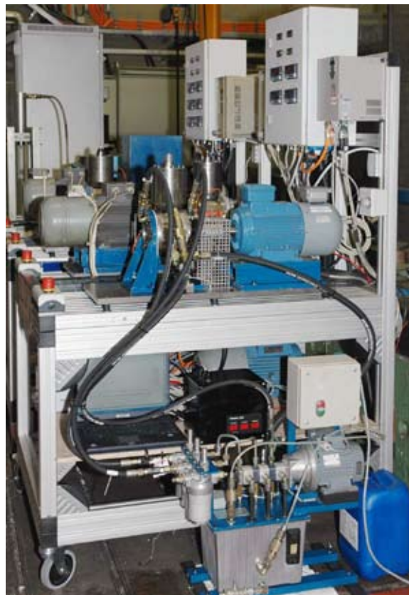
Pamas utilise la technologie volumétrique sur tous ses appareils, ce qui permet un comptage précis de l'ensemble des particules. Photo : montage du compteur en ligne sur un banc d'essai

« Avec la crise, les clients ont tendance à choisir les huiles les