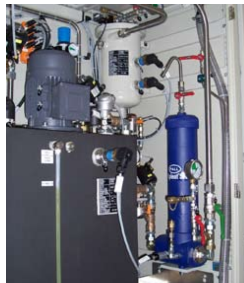
Compartment hydraulique d'un banc d'essai doté d'un filtre Ultipleat SRT : design plus compact et résistance aux contraintes mécaniques, maîtrise de la pollution et protection de l'environnement améliorées

De fait, la condensation de l'eau, la contamination par l'huile et la présence de particules de poussière apparais-